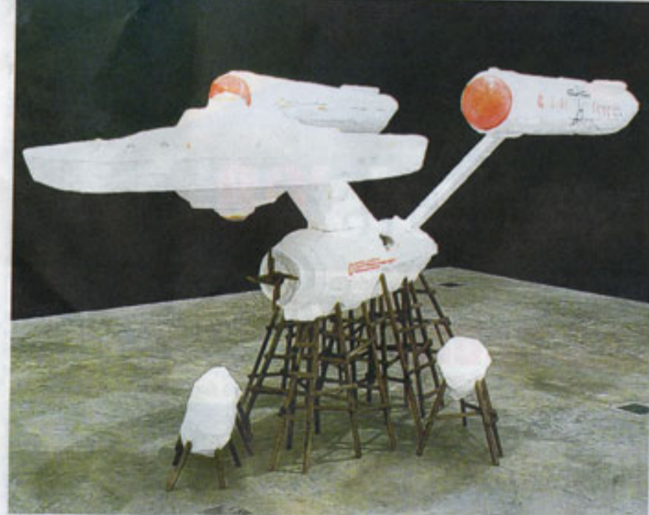
Back to the future. Holbewoners hebben bezit genomen van de Enterprise , het ruimteschip uit Star Trek .