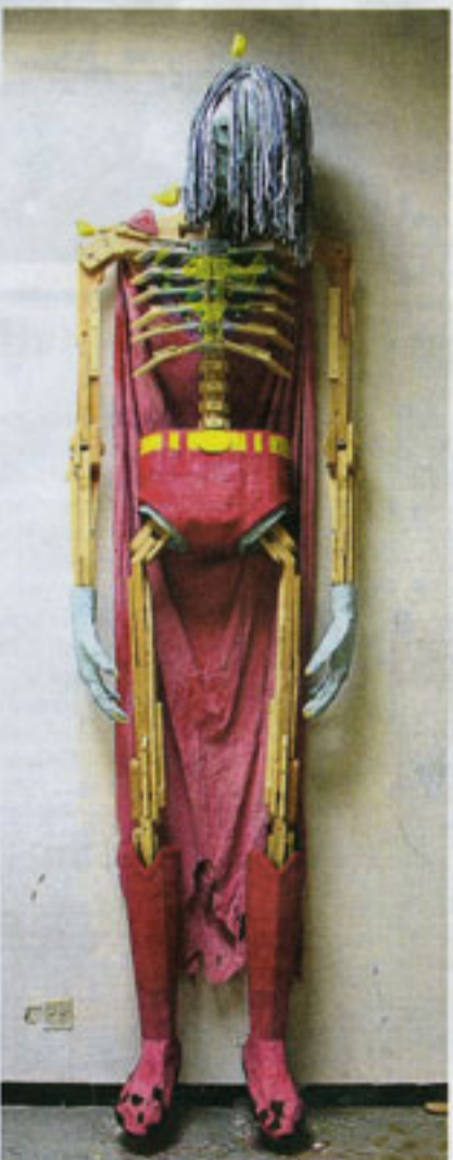
Beautiful Superman, de stripheld na zijn dood.