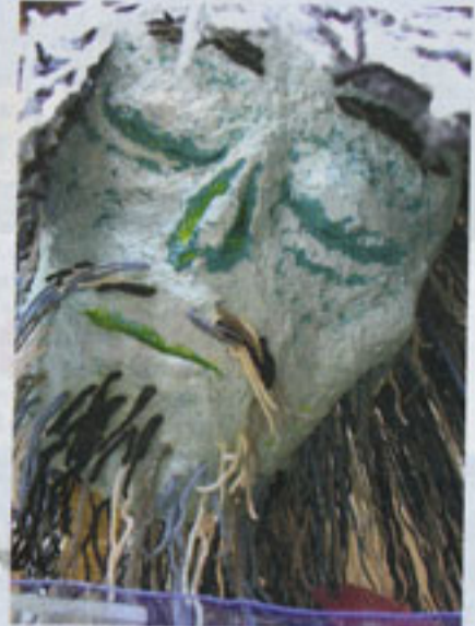
Het hoofd van Beautiful Superman, dat associaties oproept met de Christusfiguur.